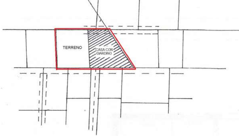
PLANIMETRIA SCALA 1:2000